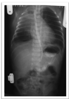
Рис 3. Очаги деструкции в верхней доле правого легкого