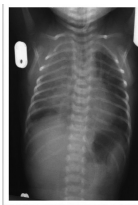
Рис 2. Тотальная правосторонняя пневмония