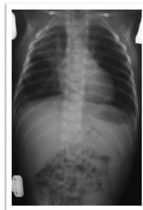
Рис 1. Инфильтративная пневмония верхней доли правого легкого

Рентгенологическими признаками, заставляющими рассматривать имеющуюся пневмонию, как деструктивную, были: полисегментарная сливная инфильтрация с вовлечением доли или всего легкого (рис.1,2), стойкий ателектаз, уплотнение междолевой плевры; на фоне инфильтрации иногда просматривались очаги просветления (рис.3). Плевральные осложнения имели классические рентгенологические признаки. (пиоторакс, пиопневмоторакс, пневмоторакс). (рис.4.)